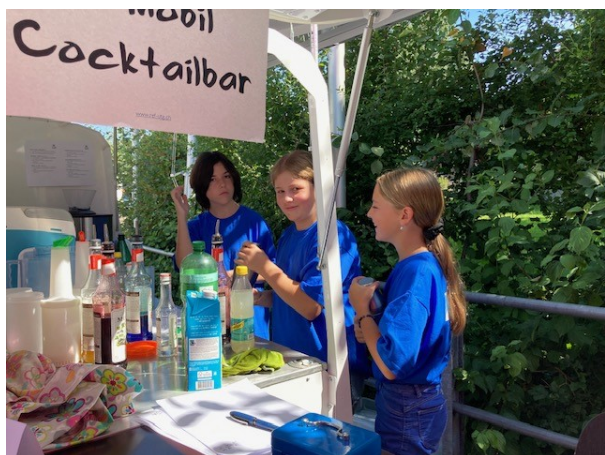
Alkoholfreie Drinks an der Cocktailbar

An einem Mittwochnachmittag hat das B-Mobil Halt auf dem Kinderspielplatz in Bütschwil gemacht. Bestückt mit einer Spielkiste aus der Ludothek waren zwei Begleitpersonen mit den anwesenden Kindern am Spielen. Ein kleiner, aber feiner Anlass, bei dem vor allem Kinder mit Migrationshintergrund die zeitliche Zuwendung genossen haben. Die Politische Gemeinde Bütschwil-Ganterschwil hat das B-Mobil beim Neuzuzügerapéro eingesetzt und die Evang. ref. Kirchgemeinde war am Dorffest mit einer von Jugendlichen betriebenen Cocktailbar vertreten.