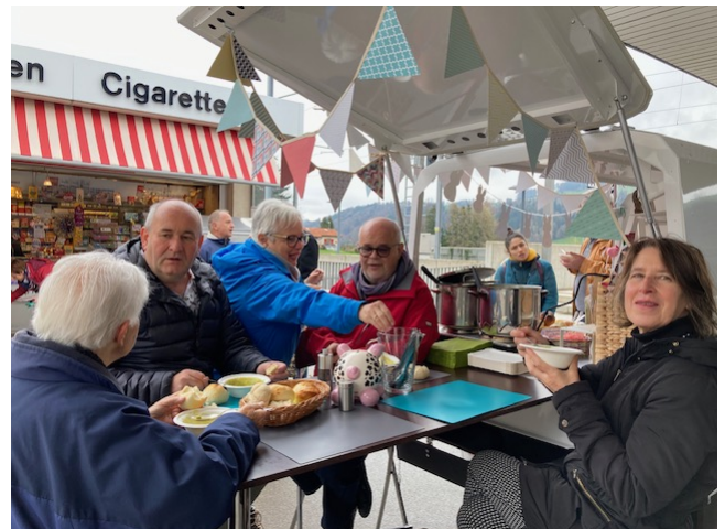
Suppenschmaus am Bahnhof Bütschwil

Seit März 2023 ist das Begegnungsmobil (B-Mobil) einsatzbereit. Mit einem Vorstellungsapéro bei den involvierten Organisationen und Trägerschaften wurde der offizielle Start gefeiert. Vorgängig hat sich ein Projektteam bestehend aus 6 Personen in mehreren Sitzungen auf die praktische Umsetzung des Projektes vorbereitet.