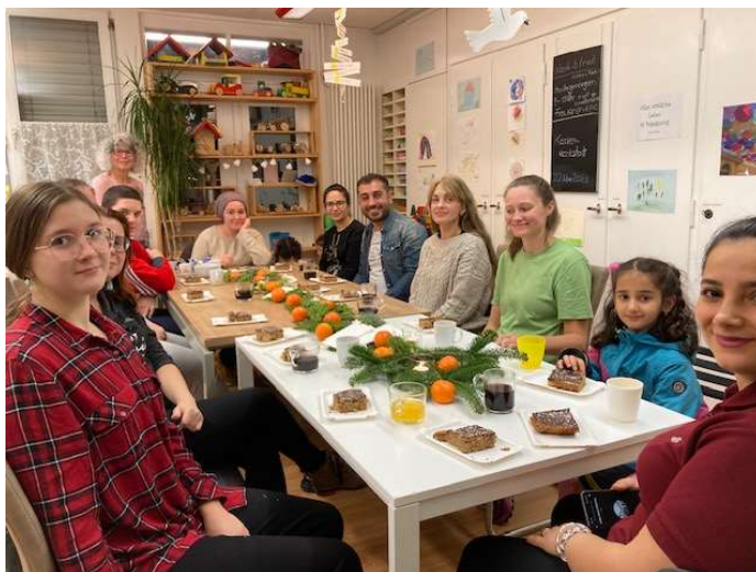
Gemütlicher Abschluss des Bastelanlass im Advent

So hat sich z.B. im vergangenen Jahr eine Gruppe zum Basteln von Engeln zusammengefunden. Diese fanden dann einen würdigen Platz auf dem Engelweg in Dietfurt, welcher gemeinsam besucht wurde. Solche Aktionen ermöglichen den Gästen vom b'treff die Teilhabe am gesellschaftlichen Leben vor Ort.