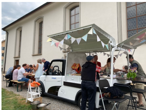
Einsatz nach einem Konzert in Mosnang

Mit dem ersten Einsatzjahr ist die Hälfte der Projektphase erreicht. Die Erfahrungen im Jahr 2024, wo nebst der involvierten Trägerschaft auch Vereine und Organisationen das B-Mobil günstig ausleihen können, wird über die Zukunft des B-Mobils entscheiden.