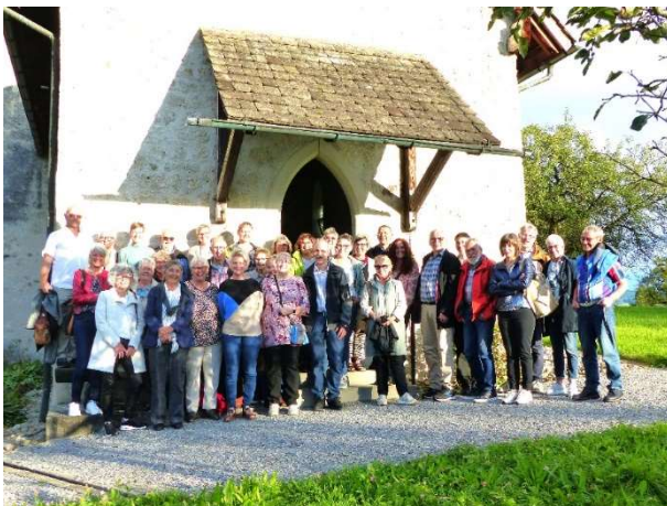
Freiwilligenteam vor der Kapelle in Tufertschwil

Die Secondhandkleiderabteilung wurde ebenfalls gerne besucht und viele zufriedene Kunden freuten sich über ein gut erhaltenes günstiges Kleidungsstück oder warme Schuhe.