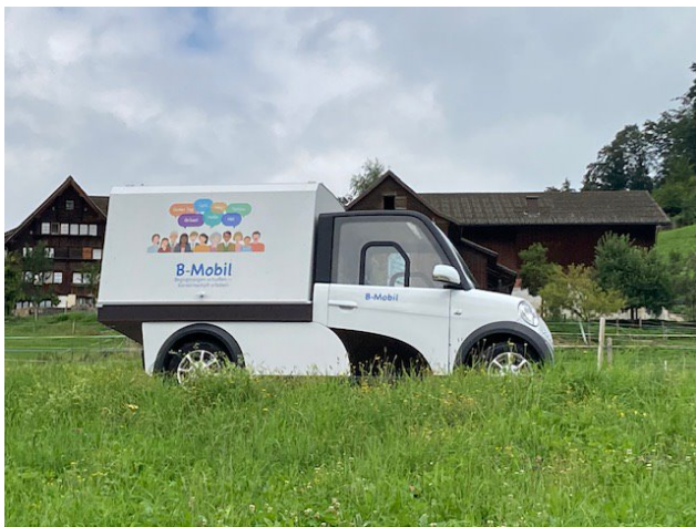
B-Mobil unterwegs zu den Menschen

Mit dem Unterwegssein des Mobils und aktivem Zugehen auf Menschen, leistete ein kleines Team einen Beitrag gegen Isolation und Vereinsamung. Dorfgemeinschaften und Nachbarschaften sollen vermehrt gepflegt werden. Die Kirche soll auf die Menschen zugehen, Gemeinschaft fördern und in die Gesellschaft hineinwirken.