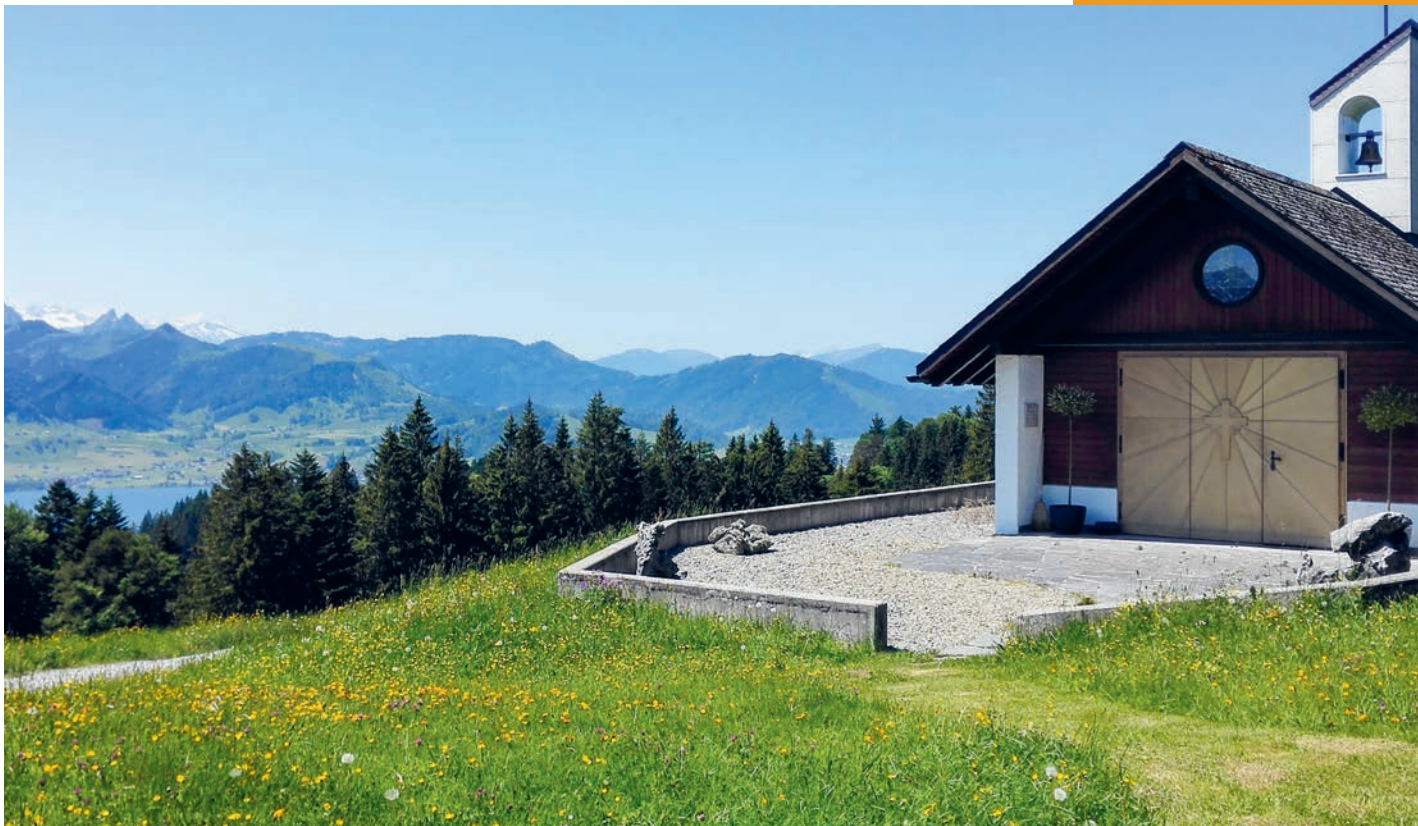
Foto: «Gueteregg-Kapelle»; Blick von der Gueteregg über den Sihlsee zu den Mythen

11 Unteres Toggenburg Bütschwil Ganterschwil Lütisburg Libingen Mosnang Mühlrütli